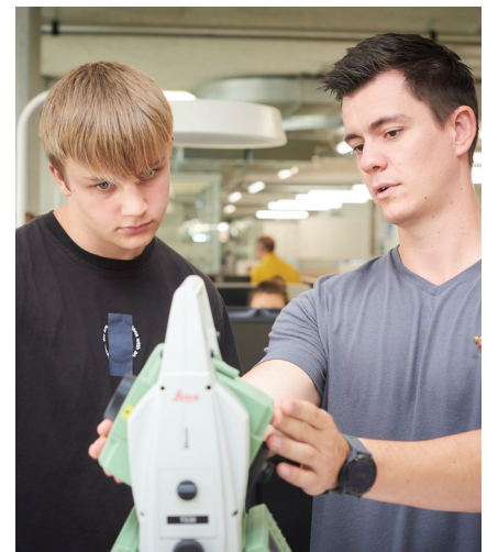
Die Lernenden werden von Berufsfachleuten während der Lehrzeit betreut, instruiert und begleitet.