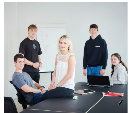
Damit der Austausch funktioniert, treffen sich Lernende und verantwortliche Ausbilder/innen regelmässig.

Wir verfügen über eine gut ausgebaute, zeitgemässe Infrastruktur. Unsere Büros liegen an zentralen, verkehrsgünstigen Standorten an der Hochstrasse in Basel und am Freilager-Platz in Münchenstein.